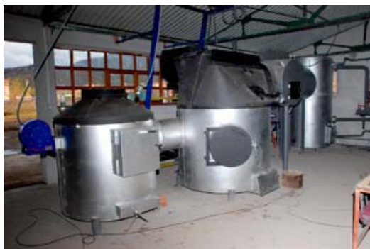
Slika 1. Sistem za insineraciju animalnog otpada

Mjerenje emisije u zrak vršena su na realnom sistemu za insineraciju animalnog otpada kapaciteta 3 t/24 sata sa toplovodnom kotlovnicom kapaciteta 450 kW, predviđenog za rad sa sistemom grijanja proizvodne hale, dodatnih objekata i plastenika za uzgoj ukrasnog cvijeća i grmlja (slika 1.). Vršena su mjerenja koncentracija prašine, CO, CO 2 , SO 2 , NO x , O 2 organskih spojeva izraženih kako ugljik, te određena je zacrtnjenost dimnih plinova. Rezultati mjerenja su svedeni na normalne uslove, suhi gas i na sadržaj kisika od 11%.