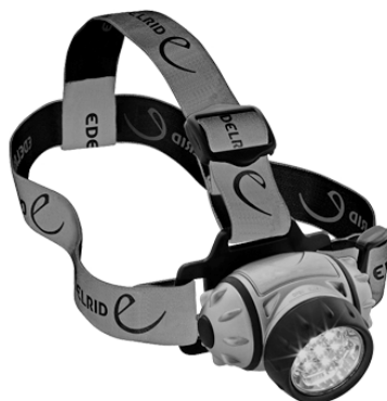
Slika 1. Testirana čeonu lampa sa LED

Subjektivne vizualne performanse LED čeonu lampu je evaluiralo 18 ispitanika, jamskih radnika, u nemetanskom jamskom okruženju lokalnog rudnika uglja. Korištena je komercijalno raspoloživa čeonu lampa prikazana na slici 1. Prema deklaraciji proizvođača lampa je namijenjena za noćni rad i radu u špiljama, i posjeduje više radnih modova.