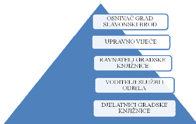
Slika 1. Upravljačka shema Gradske knjižnice Slavonski Brod

Upravno vijeće na prijedlog ravnatelja donosi programe rada i razvitka knjižnice, nadzire njihovo izvršavanje, odlučuje o financijskom planu i godišnjem obračunu, donosi Statut i druge opće akte, utvrđuje način i uvjete korištenja knjižnične građe, odlučuje o promjenama u organiziranju rada knjižnice, te obavlja druge poslove određene zakonom.