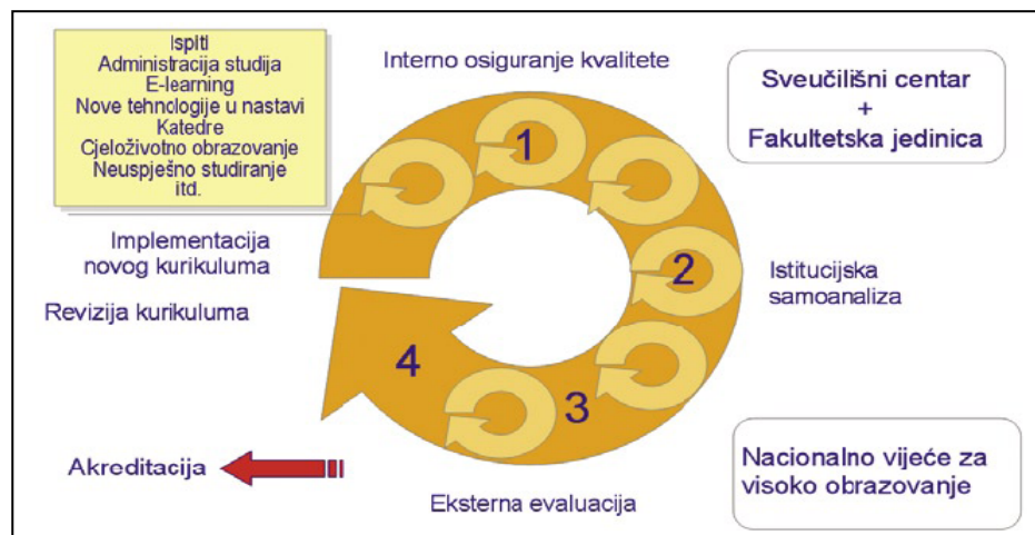
Slika 2. Ciklusi kvalitete u nacionalnom sustavu za osiguranje kvalitete [2]

Sustav izgrađuje svaka visokoobrazovna institucija nezavisno, na načelu supsidijarnosti, u skladu sa svojom misijom i ciljevima. Mehanizmi se odnose na programe, dijelove programa i na cjelokupno institucijsko djelovanje, te se temelje na ulazima i ishodima. [6,9]