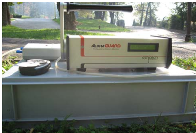
Slika 2. Sistem AlphaGUARD PQ 2000 PRO

Alpha Guard System PQ2000sistem je efikasno prevazišao probleme pasivnih detektora sa jednim očitavanjem i sada se koristi u mnogim modernim svjetskim laboratorijama za detekciju radona i njegovih potomaka u svim ambijentalnim sredinama. Sistem pored radona simultano mjeri temperaturu vazduha, atmosferski pritisak i relativnu vlažnost vazduha, dakle one meteorološke parametere koji su u dubokoj korelaciji sa distribucijom radona. Ovaj sistem je podržan profesionalnim Alpha Expert softverskim paketom za multiparametarsku analizu kao i grafičku vizuelizaciju dobijenih podataka i njihovo arhiviranje.