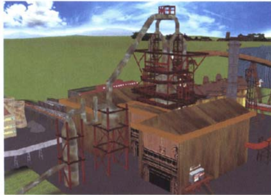
Slika 1. Virtualna posjeta jednoj čeličani [5]

učenje ili ljudske komunikacije. Sve se više koristi virtualni način prezentacija, kako bi se uštedilo na vremenu i novcu. Najnoviji trendovi su u prezentacijama studentima ne samo pojedinih postrojenja, nego i čitavih fabrika i proizvodnih procesa, tako da na primjer student može posjetiti kompletnu čeličanu a da ne napusti učionicu (Slika 1) [4, 5].