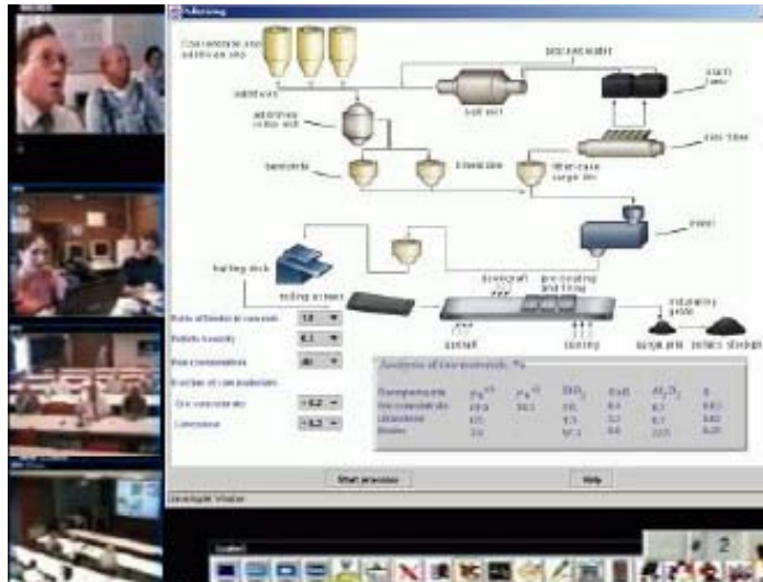
Slika 4. Videokonferencija kursa «Metalurgija gvožđa» pod pokroviteljstvom IEHK, RWTH Aachen [8]

Neke od prednosti e-učenja i učenja na daljinu su: