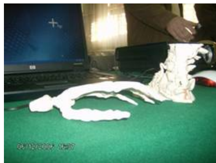
Slika 2. Model savremene tehnologije 3D printanja predstavljen na Univerzitetu u Zenici uz kombinaciju video-linka [6]

U modernoj edukaciji i prezentaciji uobičajeni su video-linkovi u upoznavanju sa novom multidisciplinarnom tehnologijom. Skori primjer je prezentacija koncepta aContex (Vizija tehnologija 3D skeniranja i 3D printanja), uz pomoć video-linka Univerziteta u Zenici sa kompanijom Ib-Procadd, Ljubljana, gdje su na mašinama pokazivani praktični rezultati onoga o čemu se u Zenici govorilo (Slika 2) [6].