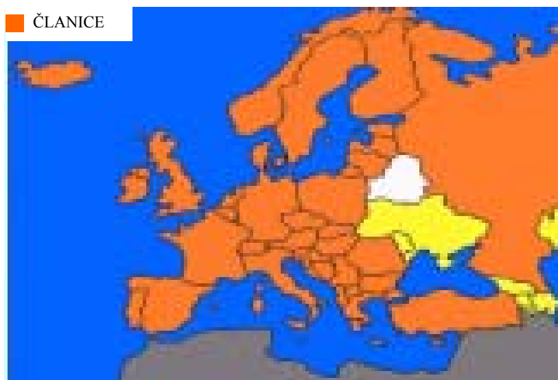
Slika 1. Zemlje članice bolonjskog procesa. [4]