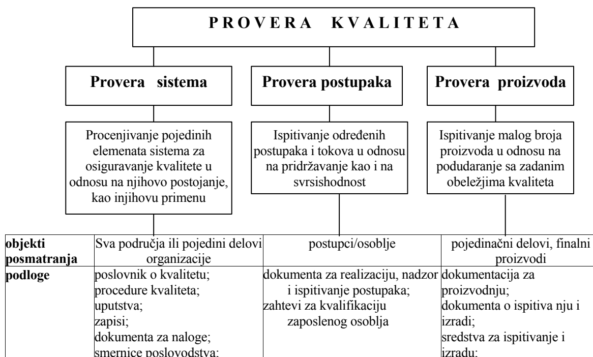
SLIKA 3. VRSTE PROVERA

Oblici ovih provera kvaliteta prikazani su na slici 3 [1]