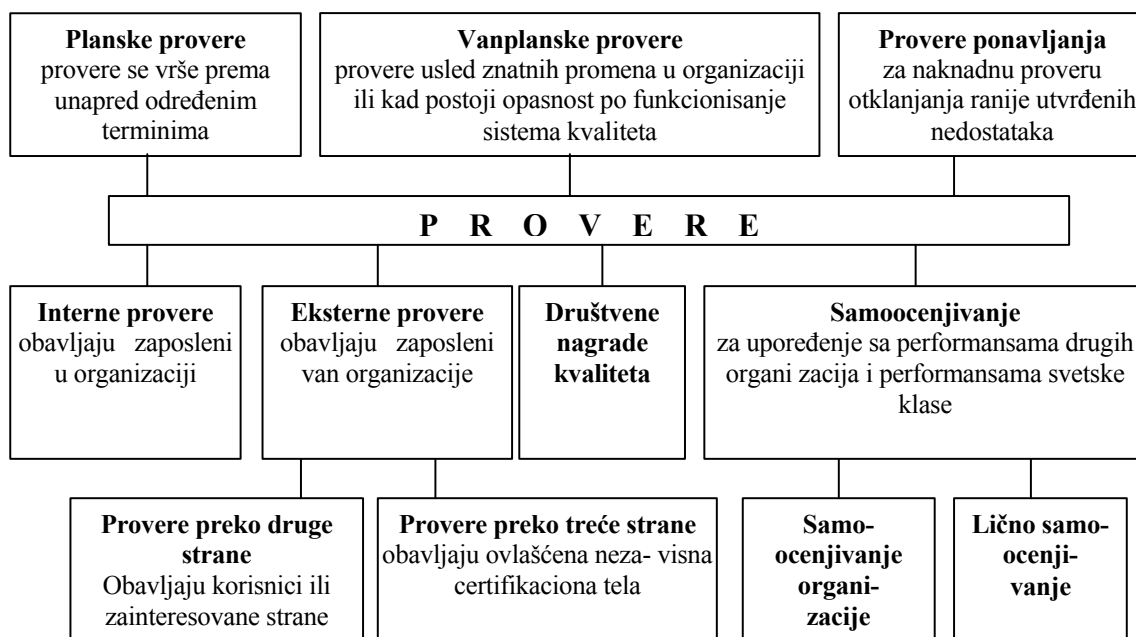
SLIKA 2. PREGLED PROVERA

Interna provera se sprovodi u cilju prikupljanja objektivnih dokaza o stvarnoj primeni dokumentovanog sistema upravljanja dokumentima, opremi, materijalima, osoblju, procesima i proizvodima. Nalazi i zapažanja se upisuju u pripremljene kontrolne liste, pri čemu se prikupljanje dokaza vrši: